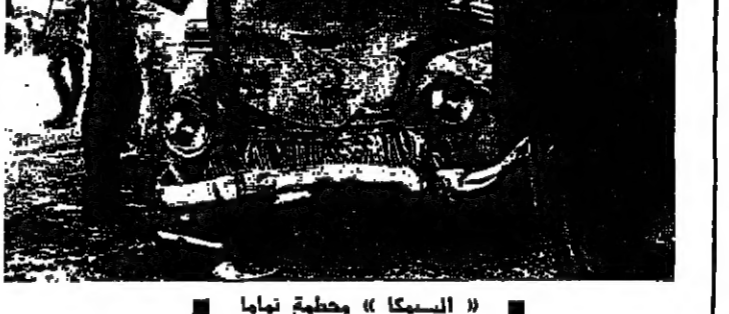
طرابلس : مكتب الانوار : قتلت امرأة وجرح تسعة أشخاص مساء امس في اصطدام سيارتين في محلة العريضة الغربية من الكفرون بالشمال .